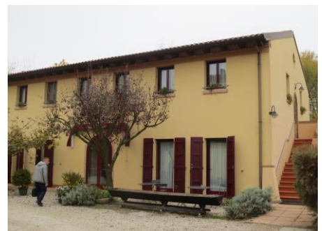
写真: 宿泊予定ホテル(ポローニャ)