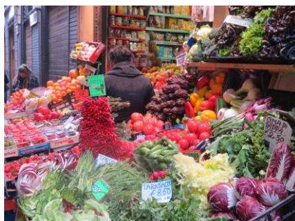
写真: ポローニャ市内のオーガニック野菜